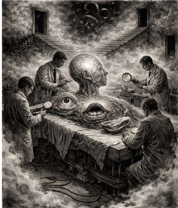
Figura 1- Autópsia dos sentidos simbolizando a subjetividade.