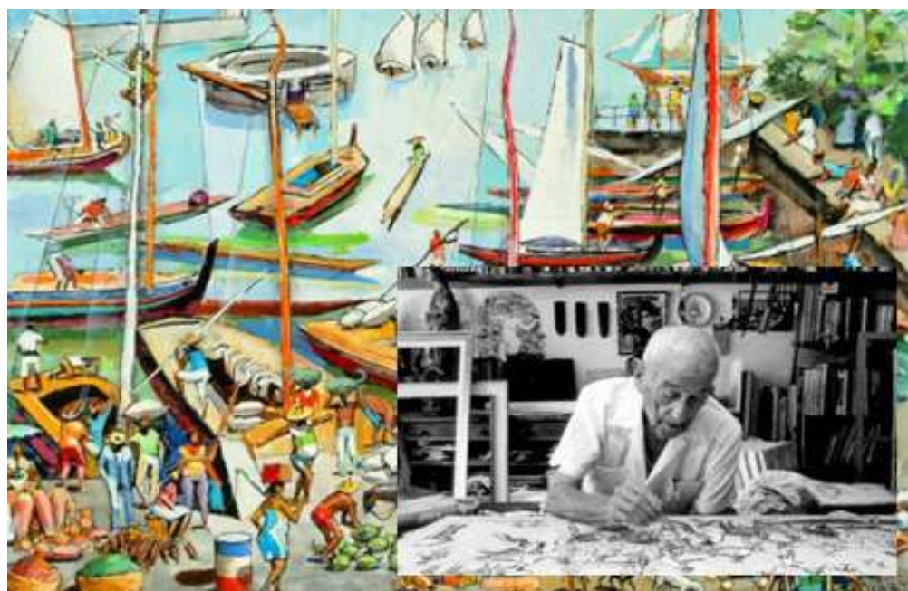
Figura 5: Pintura Porto, de Carybé e foto de Carybé Trabalhando