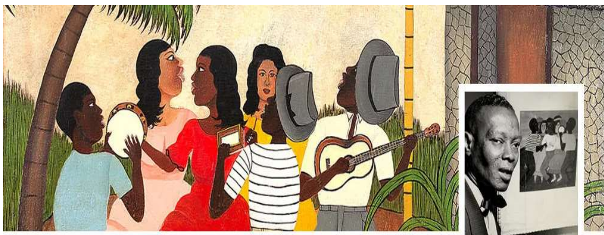
Figura 4: Pintura e retrato de Heitor dos Prazeres