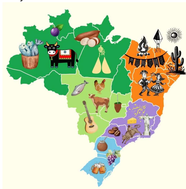
Figura 1: Representação das diversidades culturais em cada região brasileira

A Figura 1 exemplifica a diversidade cultural no Brasil, apresentando imagens representativas do folclore e de costumes de maneira figurativa.