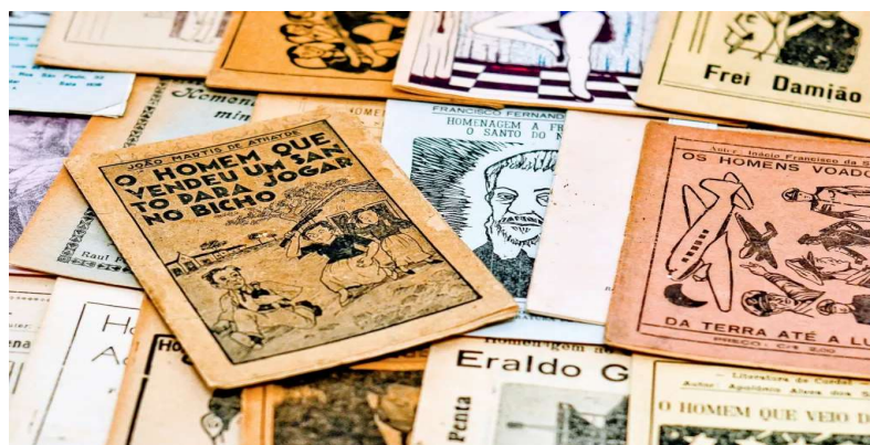
Figura 2: Tradição popular- literatura de cordel